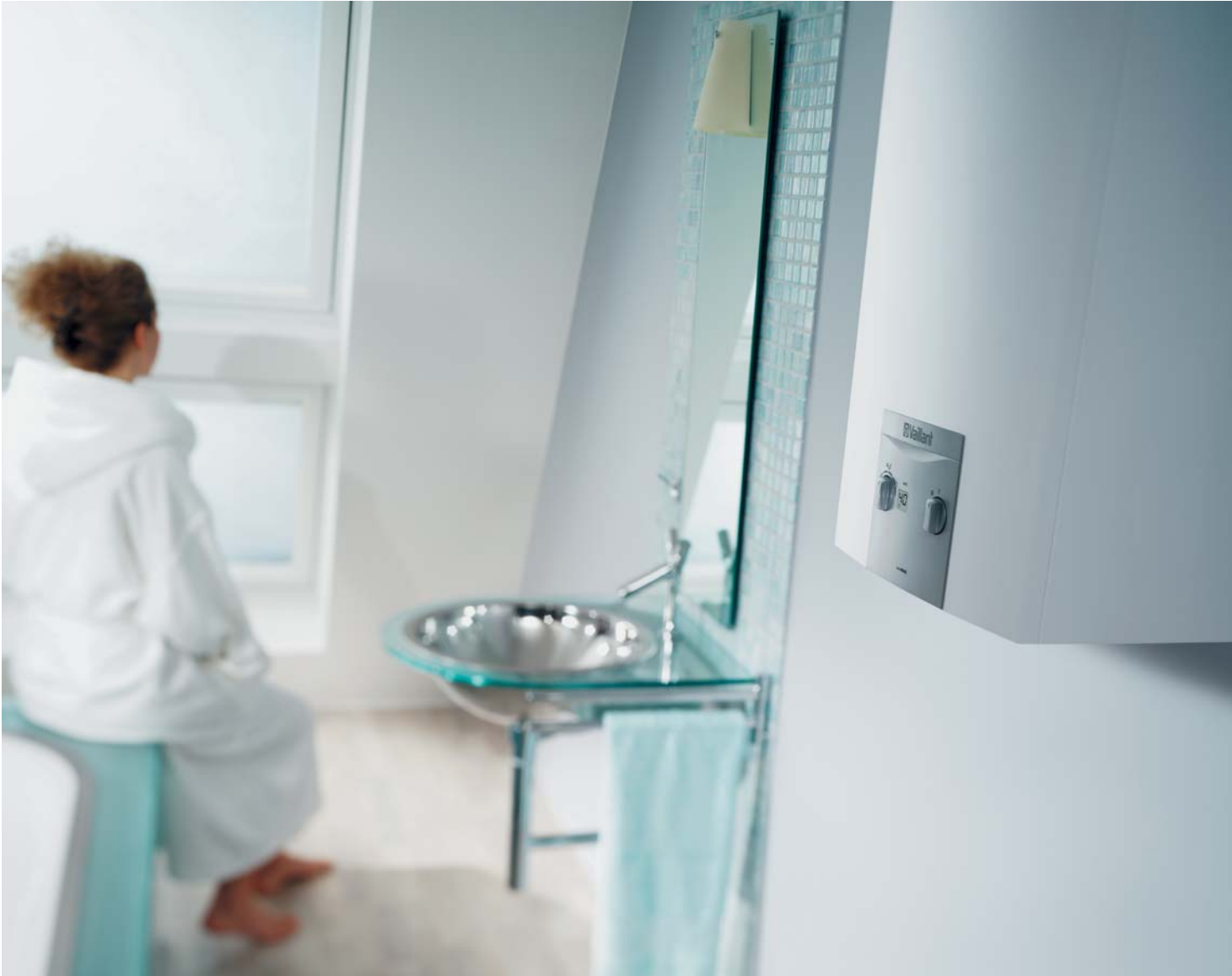
Chauffe-eau - Chauffe-bains Gaz