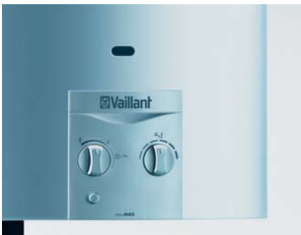
atmoMAG piezo 11 et 14