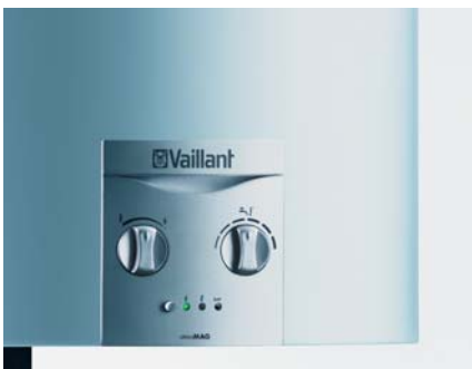
atmoMAG générateur 11 et 14